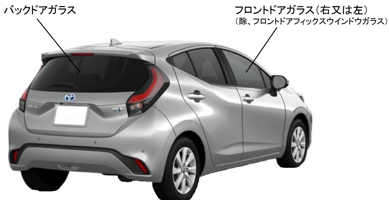
図1 フィルムの施工箇所 【1級】